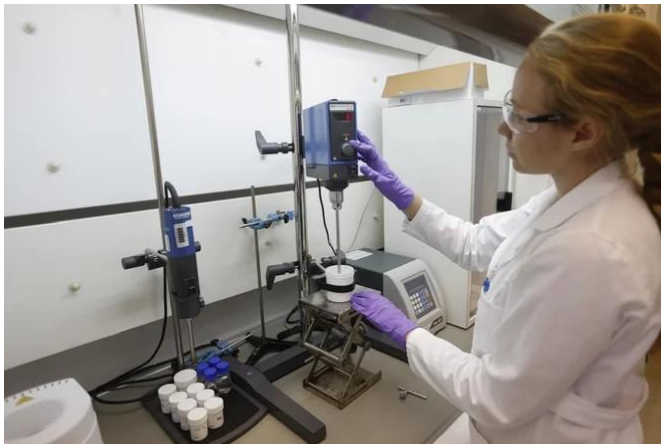
Kemijski inštitut letos praznuje 80 let.